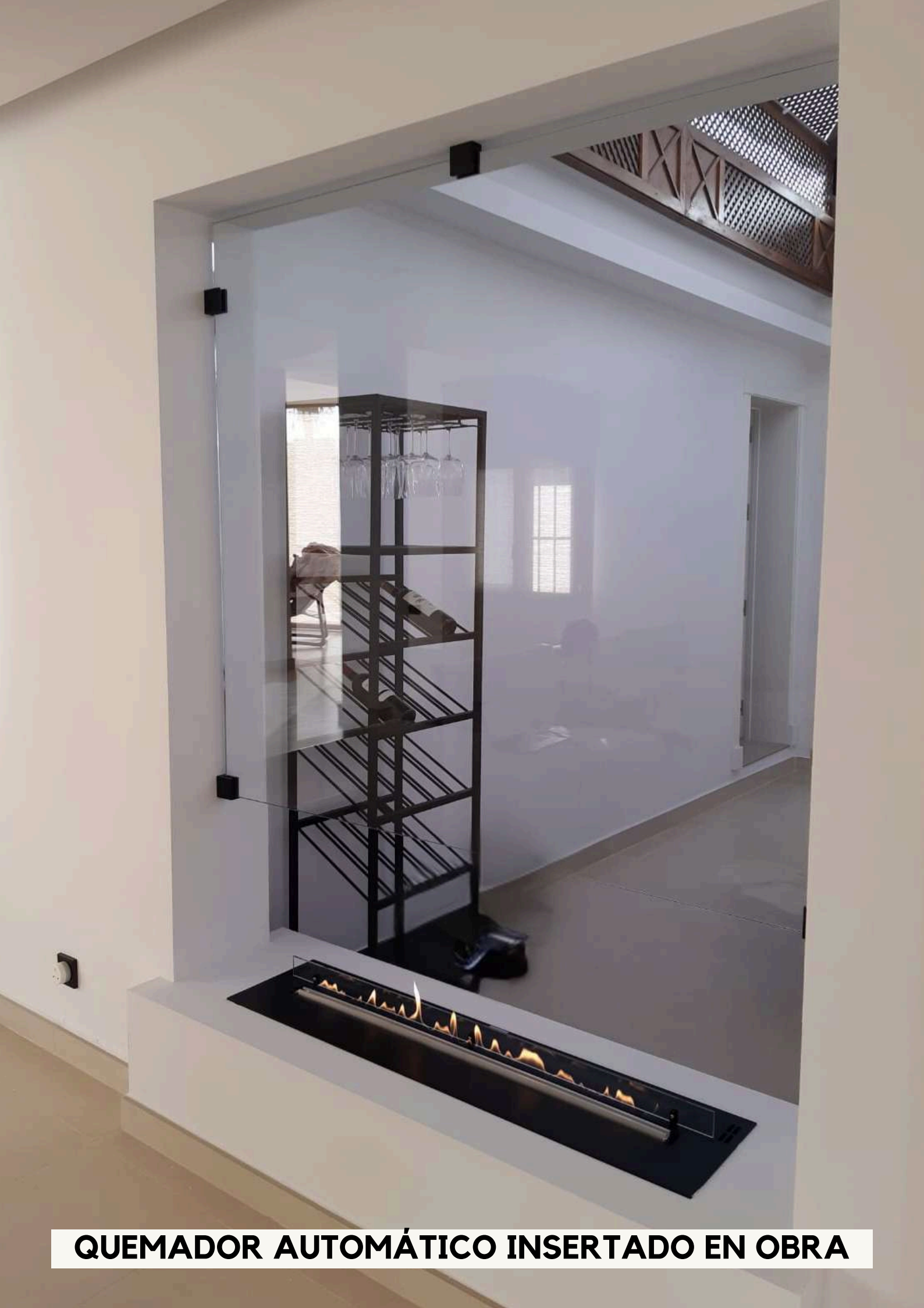
QUEMADOR AUTOMÁTICO INSERTADO EN OBRA