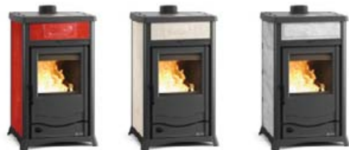
Liberty Burdeos Liberty Pergamino Antiguo Piedra natural (PT)

Revestimiento externo de mayólica o piedra natural