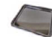
BANDEJA ESMALTADA (1 pieza)