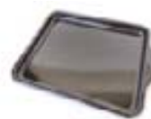
BANDEJA ESMALTADA (1 pieza)