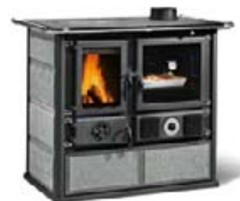
Piedra natural (PT)